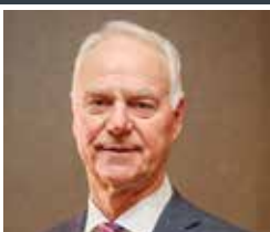
LES TREVOR Alberta, Montana, Saskatchewan et Nord du Wyoming