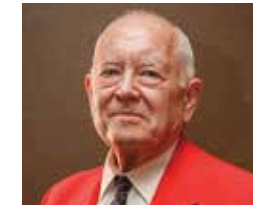
MYRON RHEAUME Ohio