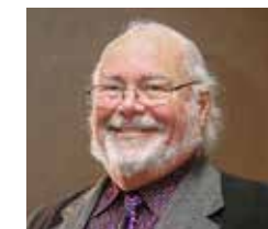
GRAPE RUSCH Sud-Ouest du Pacifique