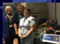
Sud-Ouest de l'Ontario