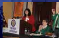
Gouverneure du district Ohio, Sue Armstrong.