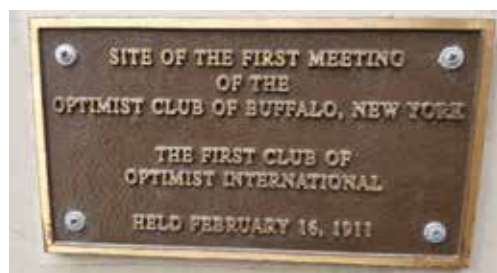
Au-dessus : Hotel Lafayette, Buffalo, New York – lieu de rencontre du premier club Optimiste en 1911 et le nouveau Buffalo-Lafayette Optimist Club.