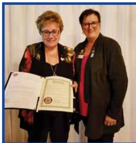
Fières d'afficher le certificat des 50 années de service Optimiste du club!